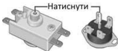
Рисунок 3. Можливі схеми розташування кнопки термовимикача

У разі виникнення внутрішньої несправності на екрані дисплея відображаються коди цих несправностей: