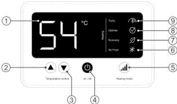
Рисунок 2. Електронна панель керування

Рисунок 2: 1 - LCD дисплей, 2 - кнопка "▲" Temperature control / збільшення температури нагріву, 3 - кнопка "▼" Temperature control / зменшення температури нагріву, 4 - кнопка "on/off" / увімкнення/вимкнення, 5 - кнопка "Heating mode" / установка потужності нагріву, 6 - індикація "No Frost" / режим антизамерзання, 7 - індикація "Economy" / режим мінімальної потужності, 8 - індикація "Optimal" / режим стандартної потужності, 9 - індикація "Turbo" / режим максимальної потужності.