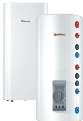
Комбіновані (непрямі) водонагрівачі