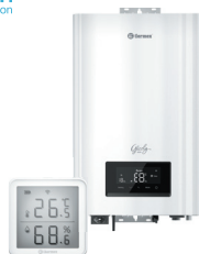
Електричні котли та кімнатні термостати