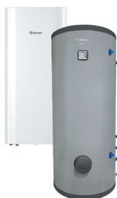
Комбіновані (непрямі) водонагрівачі