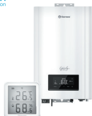
Електричні котли та кімнатні термостати