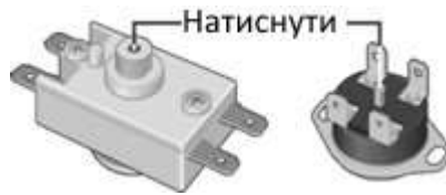
Рисунок 2. Можливі схеми розташування кнопки термовимикача